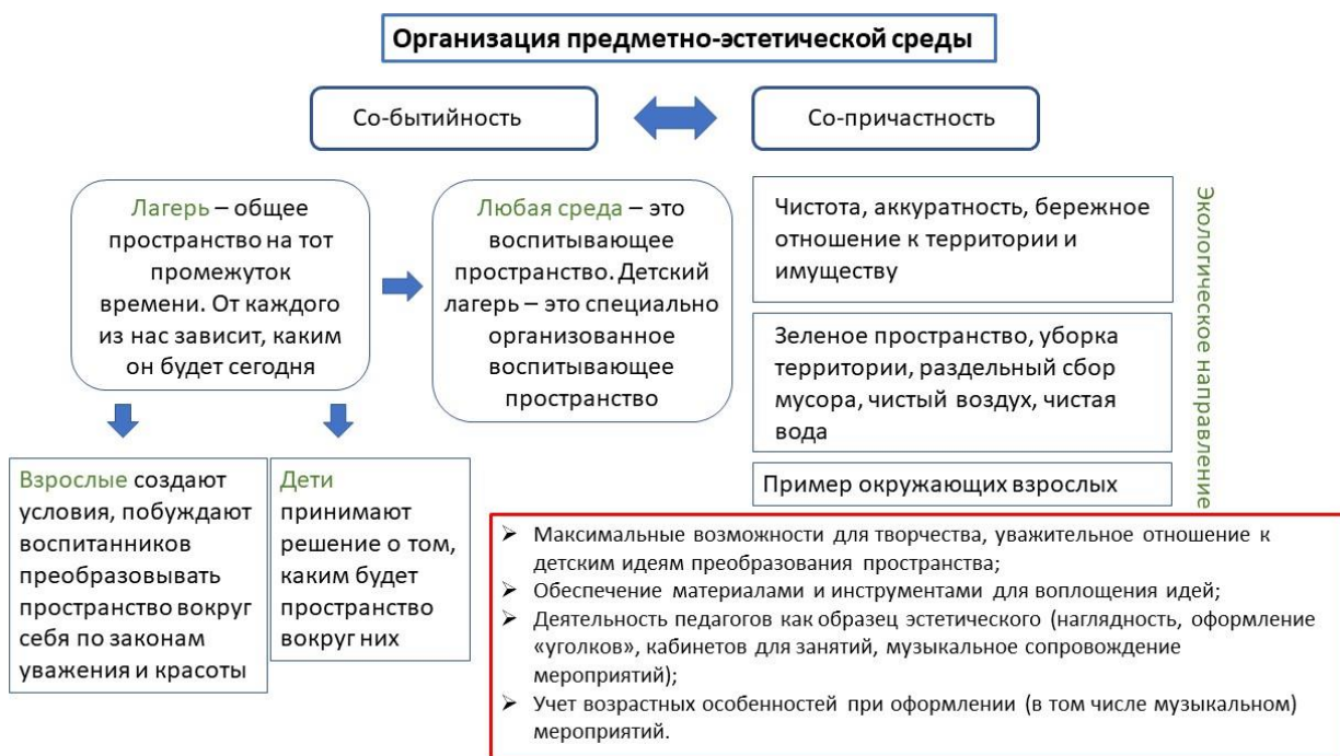
Схема 11 Реализация модуля «Организация предметно-эстетической среды» в ЗОЛ ЧУ ФОК «Гагаринский»