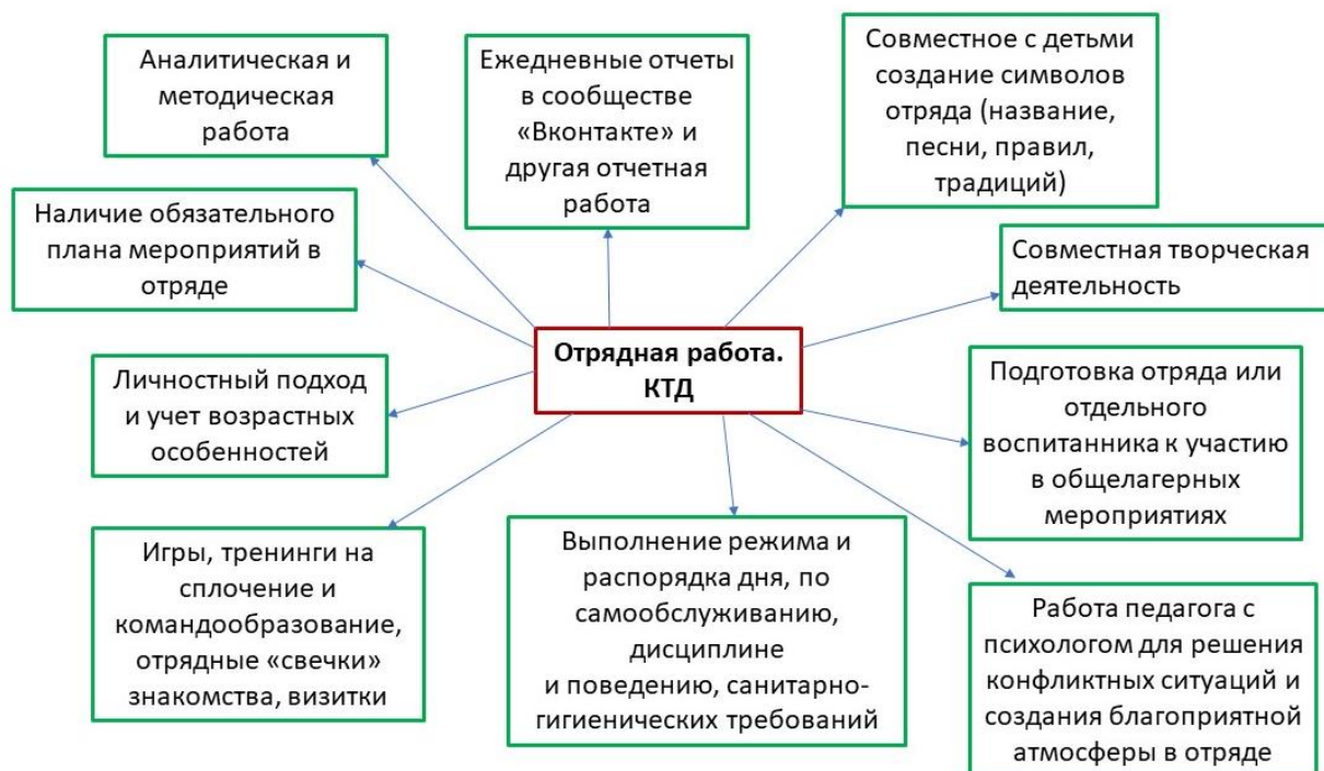
Схема 4 Реализация модуля «Отрядная работа. КТД» в ЗОЛ ЧУ ФОК «Гагаринский»